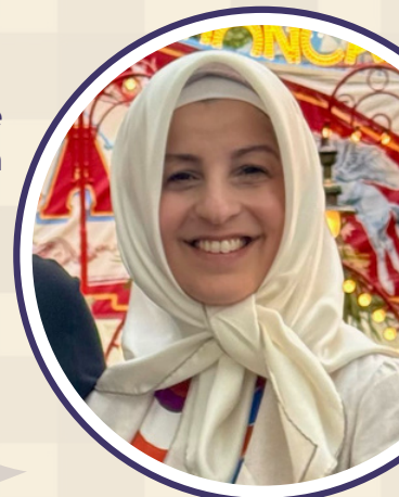
Elternvertreterin "Die Brücke"

Jede Woche widmen wir uns spannenden Themen, die Sie als Eltern unterstützen: